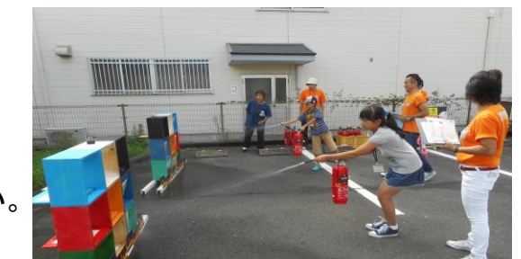
第3回~きみも防災ヒーロー!楽しくしっかりまなぼうさい~