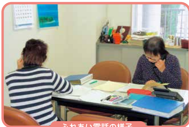
ふれあい電話の様子