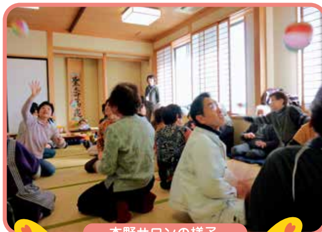
本野サロンの様子